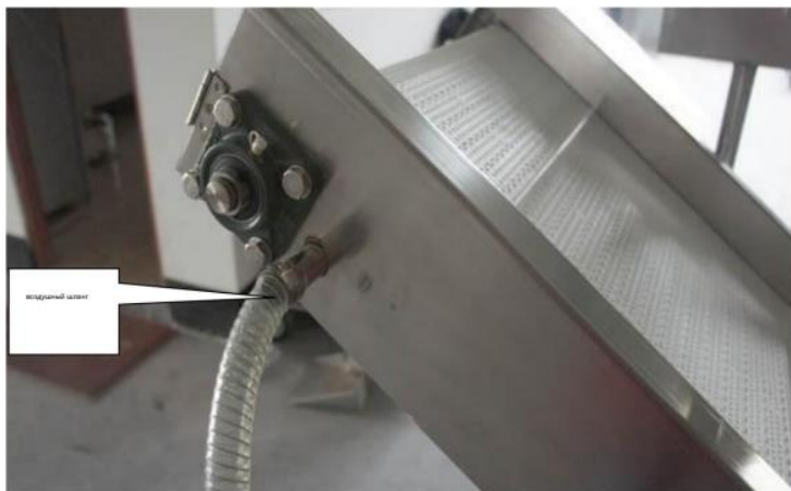
Рис3. Патрубок отвода

Внутри конвейерной ленты имеется воздуховод для удаления листьев овощей и капель воды с ленты.