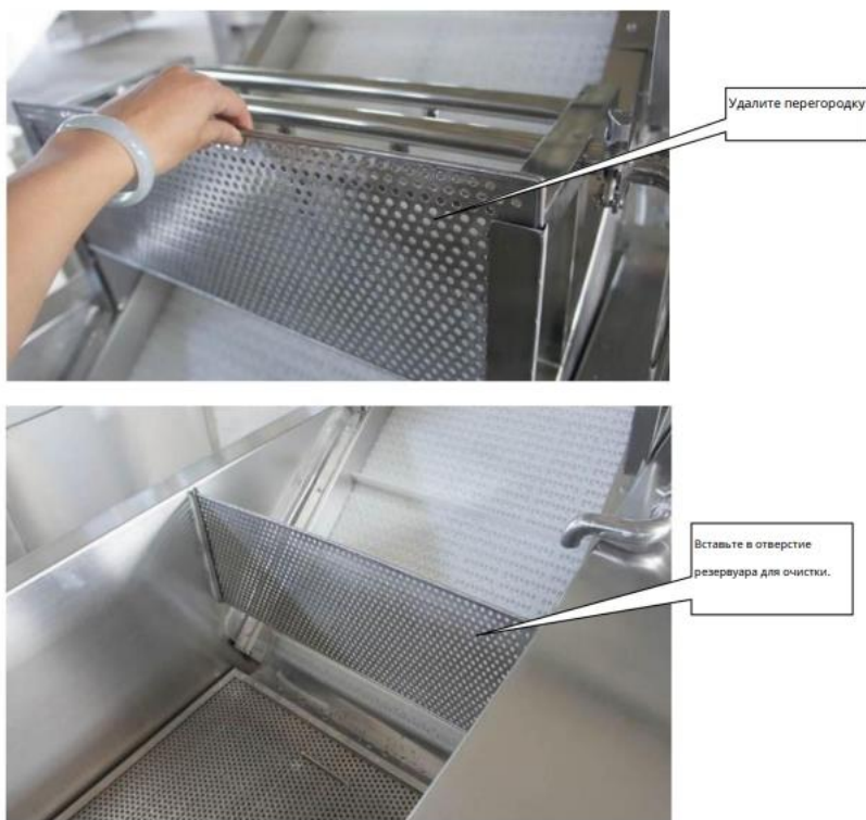
Рис1 Установка и изменение положения сетчатой перегородки.

Дополнительно процесс выдачи продукта можно регулировать, установив перегородку. Сетчатую перегородку над конвейерной лентой можно снять и вставить в пазы внутри моечного бака, чтобы предотвратить скопление овощей на конвейерной ленте во время мойки (как показано на рис1).